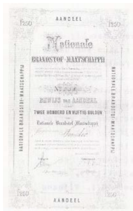
Aandeel van f 250 in de in 1864 opgerichte NATIONALE BRANDSTOF-MAATSCHAPPIJ

Maar dit veranderde snel na de bevrijding. In het bezettings/bevrijdings jaar 1813 liepen er in Amsterdam slechts 40 koopvaardisshepen binnen en de halve bevolking leefde van de bedeling. Door het krachtig ter handnemen van het bestuur door Koning Willem I kwamen er ongekende stimulansen voor vrijwel alle takken van de volkswelvaart.