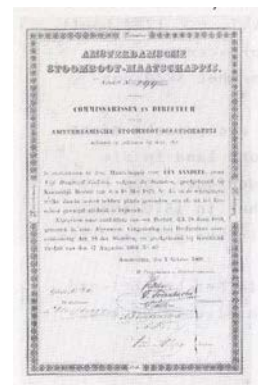
Aandeel van de in 1826 opgerichte AMSTERDAMSCH-STEAMBOOT- MAATSCHAPPIJ van PAUL VAN VLISINGEN, die geheel rechts onderaan heeft getekend

Paul van Vlissingen kon met steun van de koning in 1823 een stoomvaartlijn op Harlingen openen vanuit Amsterdam. Uit dit maatschappijtje is de huidige Werkspoor ontstaan, op de plaats waar in 1608 het eerste V.O.C. schip van de helling liep dat in Amsterdam werd gebouwd.